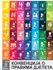
КОНВЕНЦИЈА О ПРАВМА ДЈЕТЕТА